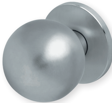
Knopf auf Rundrosette