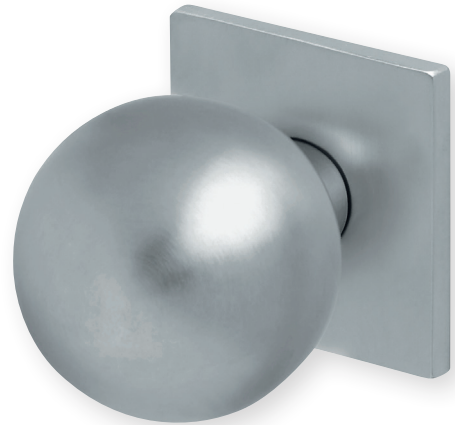
Knopf auf Quadratrosette