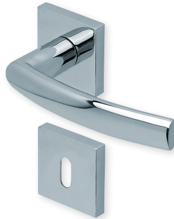
Drücker Edelstahl poliert Rosette Edelstahl poliert