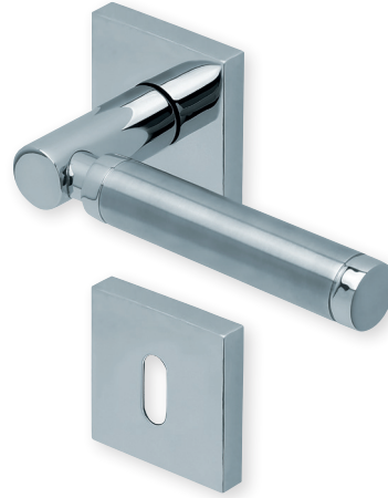
Drücker Edelstahl poliert/matt Rosette Edelstahl poliert