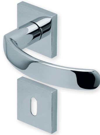
Drücker Edelstahl poliert Rosette Edelstahl poliert