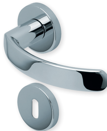
Drücker Edelstahl poliert Rosette Edelstahl poliert