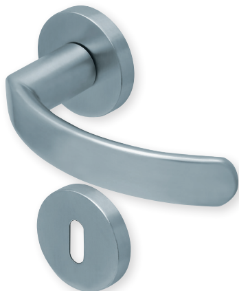
Drücker Edelstahl matt Rosette Edelstahl matt