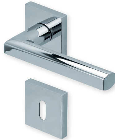
Drücker Edelstahl poliert Rosette Edelstahl poliert