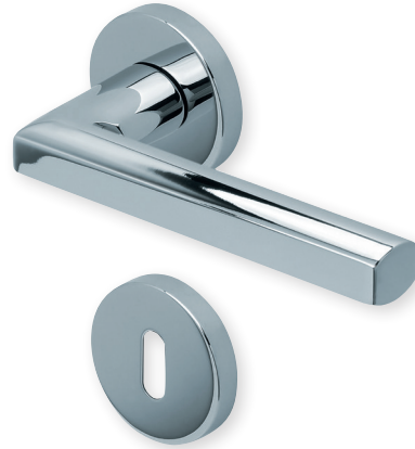
Drücker Edelstahl matt Rosette Edelstahl poliert