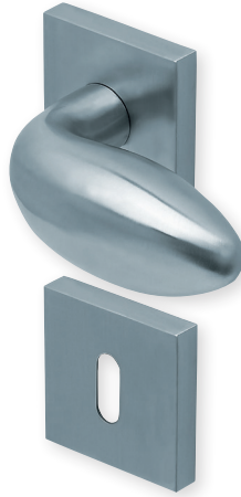
Drücker Edelstahl matt Rosette Edelstahl matt