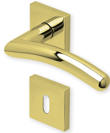
Drücker PVD Messinggelb Rosette PVD Messinggelb