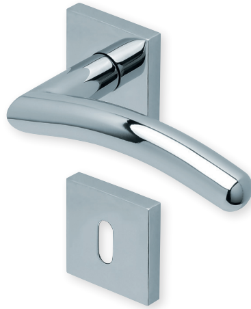
Drücker Edelstahl poliert Rosette Edelstahl poliert