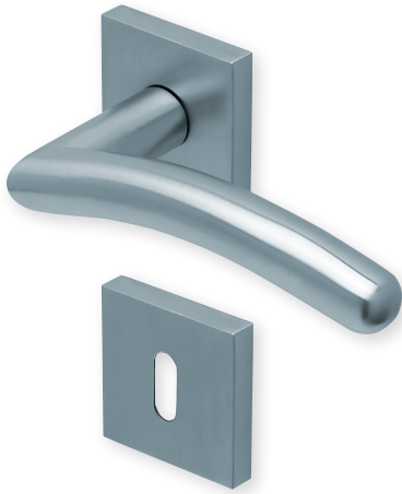
Drücker Edelstahl matt Rosette Edelstahl matt