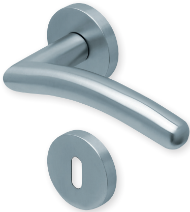
Drücker Edelstahl matt Rosette Edelstahl matt