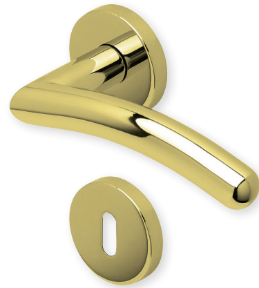
Drücker PVD Messinggelb Rosette PVD Messinggelb