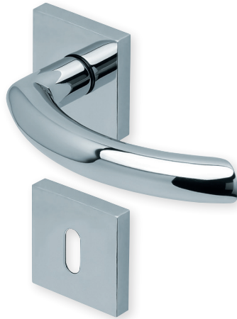
Drücker Edelstahl poliert Rosette Edelstahl poliert