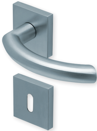
Drücker Edelstahl matt Rosette Edelstahl matt