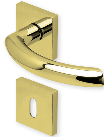
Drücker PVD Messinggelb Rosette PVD Messinggelb