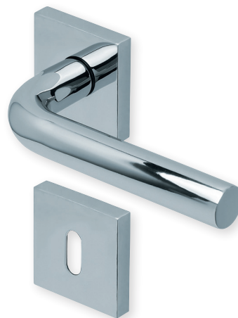
Drücker Edelstahl poliert Rosette Edelstahl poliert