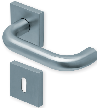
Drücker Edelstahl matt Rosette Edelstahl matt