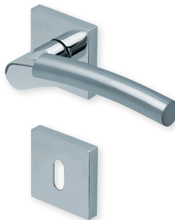
Drücker verchromt/nickelmatt Rosette Edelstahl poliert