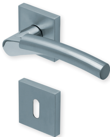
Drücker verchromt/nickelmatt Rosette Edelstahl matt