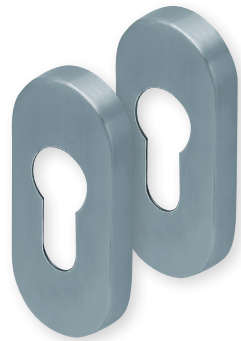
PZ Edelstahl matt