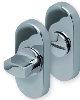
WC Edelstahl poliert