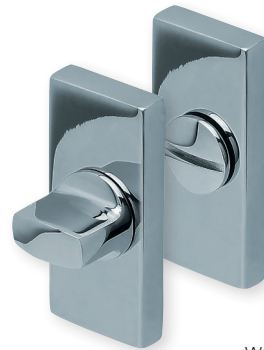
WC Edelstahl poliert