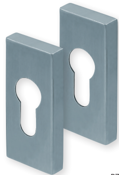
PZ Edelstahl matt