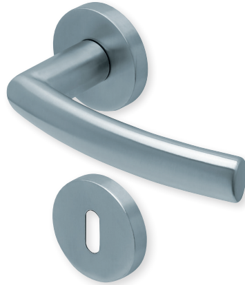
Drücker Edelstahl matt Rosette Edelstahl matt