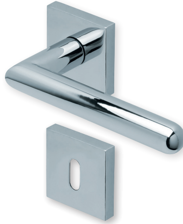
Drücker Edelstahl poliert Rosette Edelstahl poliert