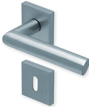
Drücker Edelstahl matt Rosette Edelstahl matt