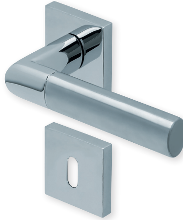
Drücker Edelstahl poliert/matt Rosette Edelstahl poliert