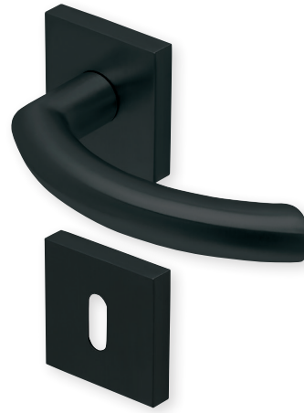
Drücker Edelstahl schwarz matt Rosette Edelstahl schwarz matt