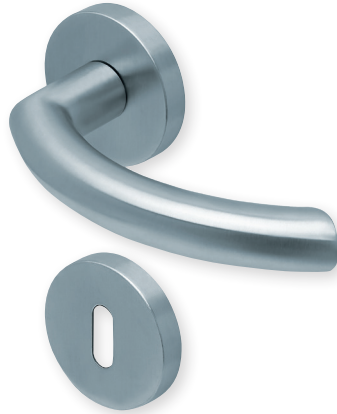
Drücker Edelstahl matt Rosette Edelstahl matt