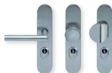
Drücker zyl. Knopf Griffplatte