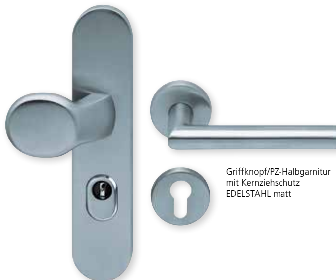
Griffknopf/PZ-Halbgarnitur mit Kernziehschutz EDELSTAHL matt