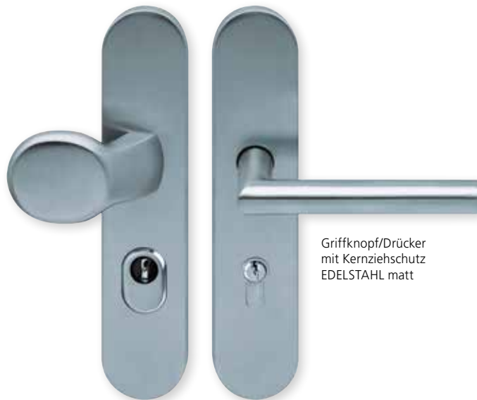
Griffknopf/Drücker mit Kernziehschutz EDELSTAHL matt