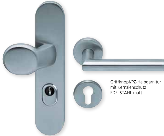
Griffknopf/PZ-Halbgarnitur mit Kernziehschutz EDELSTAHL matt