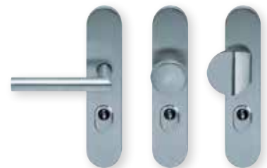
Drücker zyl. Knopf Griffplatte