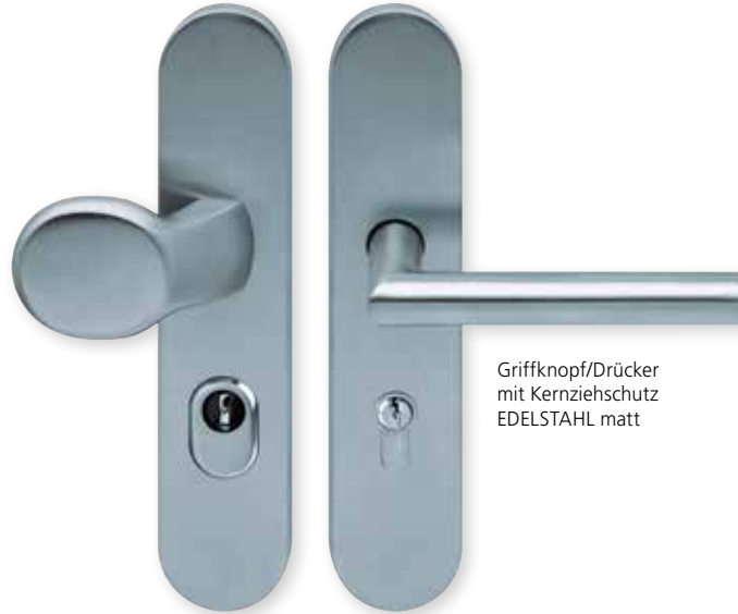
Griffknopf/Drücker mit Kernziehschutz EDELSTAHL matt