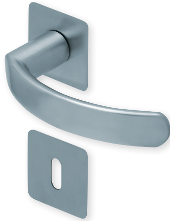
Drücker Edelstahl matt Rosette Edelstahl matt