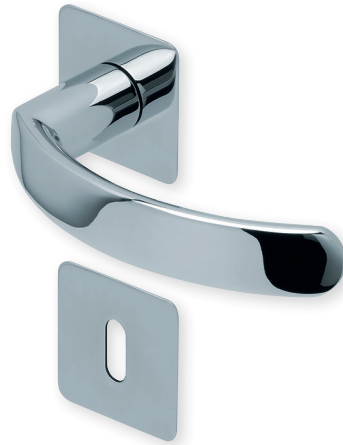
Drücker Edelstahl poliert Rosette Edelstahl poliert