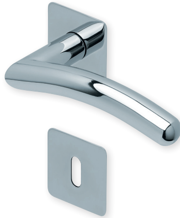
Drücker Edelstahl poliert Rosette Edelstahl poliert