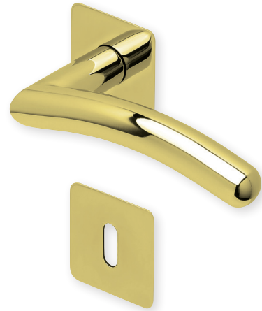
Drücker PVD Messinggelb Rosette PVD Messinggelb