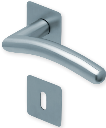
Drücker Edelstahl matt Rosette Edelstahl matt