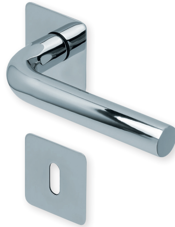
Drücker Edelstahl poliert Rosette Edelstahl poliert